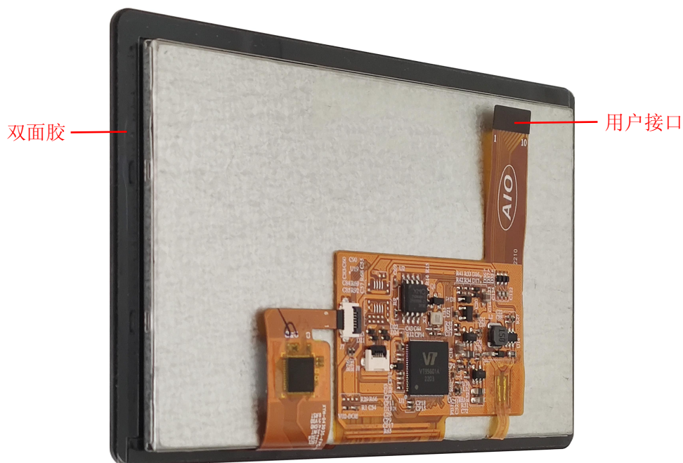
图1 产品外观及硬件配置图